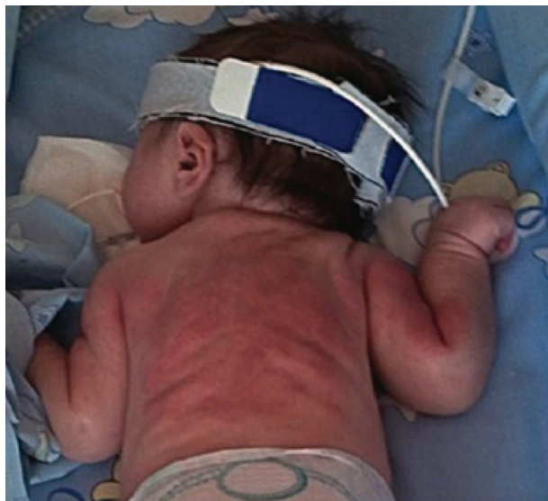
Figura 1. Lesão em placa, eritematosa, dura ao toque.