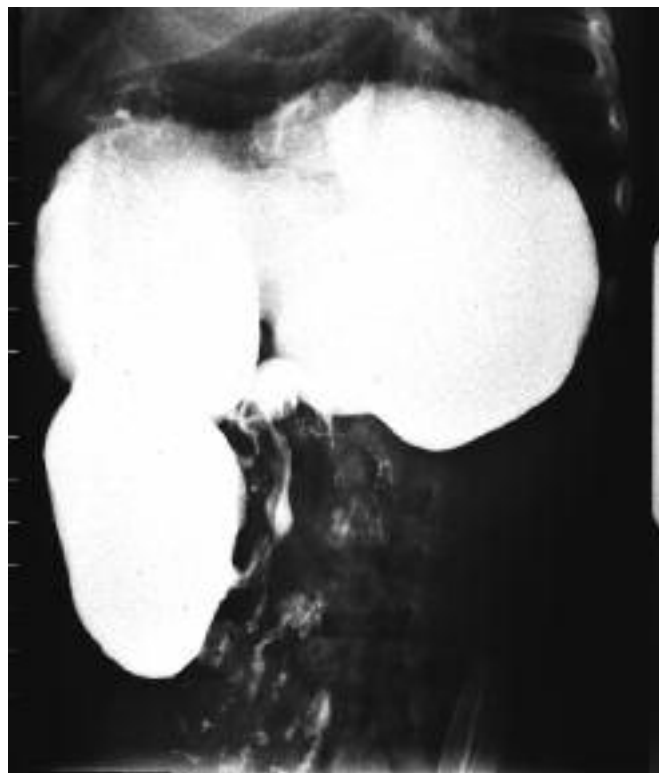
Figura 2 – Estudo radiológico contrastado do trânsito gastro-esofágico: estômago distendido e hipercinético com ausência de passagem de contraste para o duodeno.

O exame radiológico gastro-esofágico com contraste, revelou estômago distendido, hipercinético e com múltiplas ondas peristálticas ineficazes, sem passagem de contraste através do piloro, que se encontrava alongado e com calibre diminuído, sugerindo EHP (Figura 2). A repetição da ecografia abdominal mostrou espessamento da parede muscular de 6,4mm. Foi submetido com sucesso a piloromiotomia de Ramstedt.