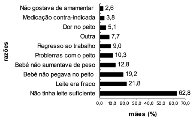
Figura 3. Razões para o abandono do aleitamento materno.

do agregado familiar ( p=0,047 ) e amamentação anterior ( p=0,037 ), sendo que o género masculino do bebé, o parto eutócico, um maior rendimento mensal médio do agregado familiar e a amamentação anterior se associaram a uma maior duração do aleitamento materno exclusivo.